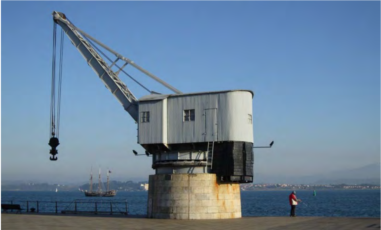
Photo : Pause de 24h à Santander. Chuis claqué. Pas de visite. Juste une balade le long du quai.