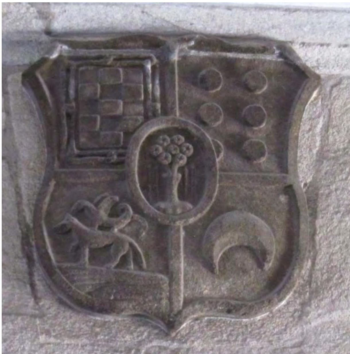
Photo : Blason, St Jacques de Compostelle, Espagne.