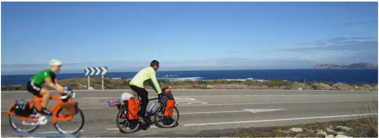
Route Côtière de Baiona vers Vigo, Galice, Espagne.

Espagne - samedi 18 février 2012, 54 502ème km, 1801ème jour.