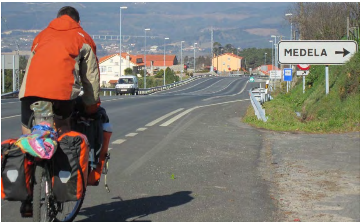
Photo : premiers km en Galice.

Avant la nuit, je m'embusque dans un départ de chemin au dessus de la route, pour poser la tente, avec vue sur l'océan et passe ainsi ma première nuit sans réveil givré ! J'y croyais plus !