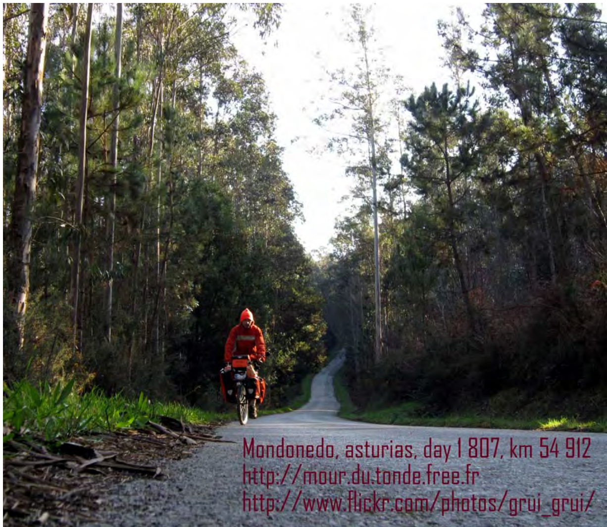
Photo : Démarrage aux premiers rayons de soleil. La tente, encore gelée, ne se plie pas. J'en suis réduit à la rouler et à l'accrocher comme je peux pour la faire sécher vers 10h du matin. En revanche, puisque ça pince, j'ai tous les vêtements sur moi : 4 couches superposées.

Côté hébergement, j'ai opté pour le "Meiga Backpackers", un peu excentré, mais vraiment agréable avec un jardin et une ambiance assez sympa. Très backpackers d'ailleurs !