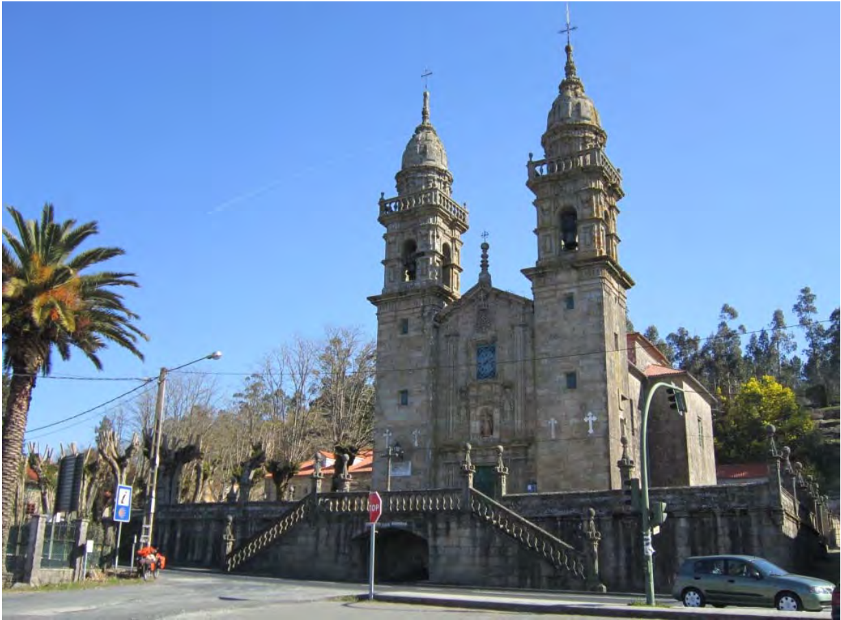
Photo : Eglise de St Esclavitude, Galice, Espagne.