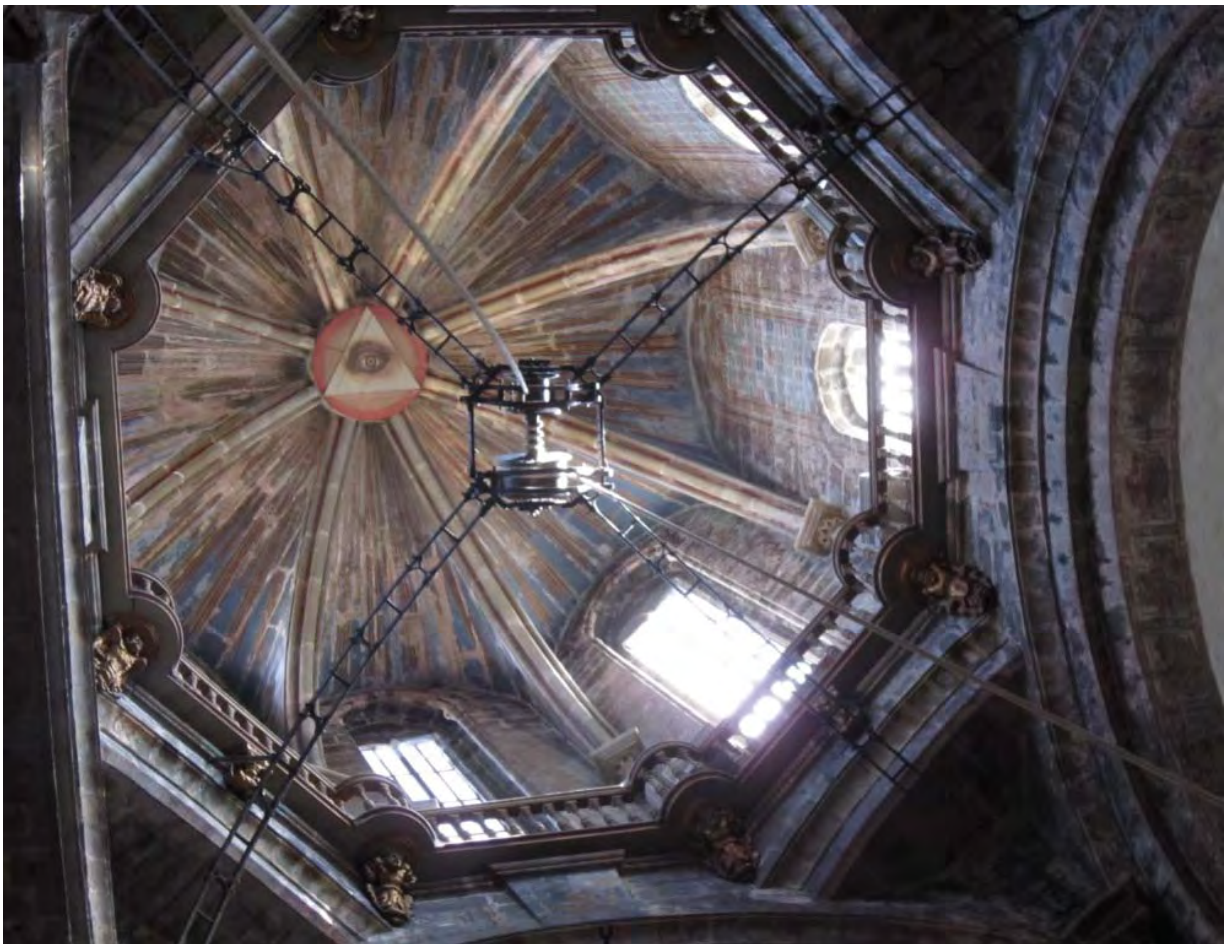
Photo : plafond de la cathédrale, St Jacques de Compostelle, Galice, Espagne.

----- Note : Retrouvez d'autres photos en plein format liées à ces étapes sur l'album Flickr d' Espagne : http://www.flickr.com/photos/grui_grui/sets/72157629246963614/ -----