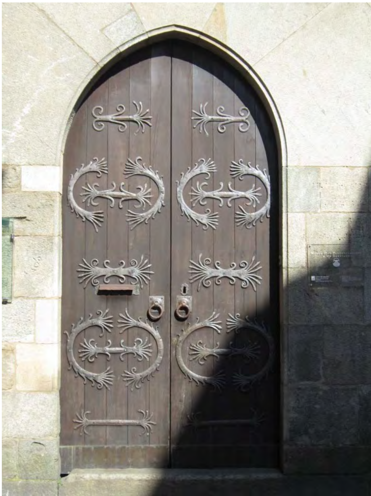
Photo : Le musée est fermé. St Jacques de Compostelle, Galice, Espagne.