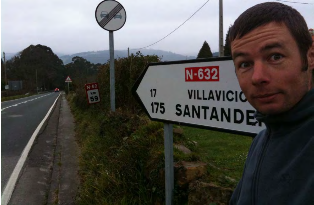
Photo : Heureusement que les paysages dépotent car avec le froid, j'arrive pas à ouvrir complètement les yeux le matin. C'est assez vallonné. Heureusement dans un sens, pour se réchauffer, mais il reste encore pas mal de kilomètres jusqu'à Santander...

Asturies. Une fois de nouveau en selle, la route est plus facile malgré le relief mais je bute à chaque ville sur l'absence de panneaux indicateurs pour trouver la route de sortie. Vilalba, Mondoñedo, Ribadeo, Navia, Aviles, Gijón, Ribandansella, Llanes.