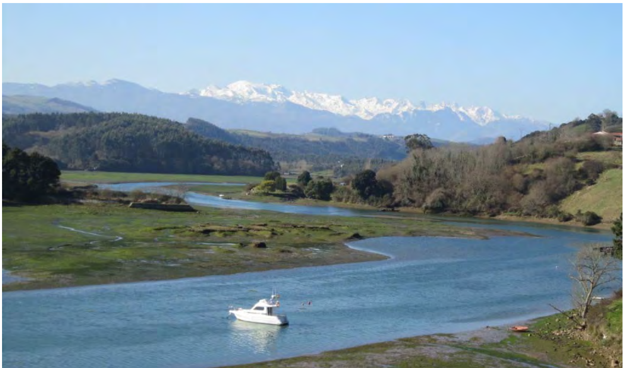
Photo : Pyrénées en vue ! San Vicente de la Barqueira, Asturias, Espagne.

A chaque fois, la signalisation m'amène près des autoroutes ou des routes interdites aux vélos. Je parviens aussi à me paumer sur l'accès au parc de Los Picos de Europa ! Comme ça, c'est fait ! J'en suis réduit à demander mon chemin 10 fois par ville, à tourner et à faire plein de km supplémentaires