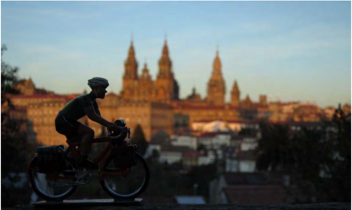
Photo : Vue de cathédrale, St Jacques de Compostelle, Espagne.