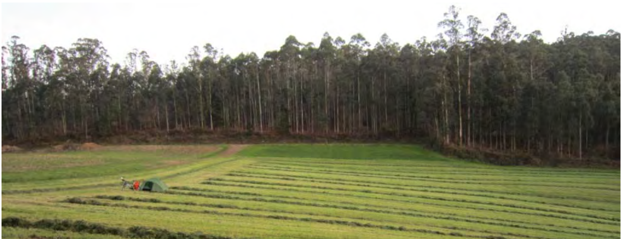
Photo : Bivouac en plein champ, Pousada, Asturies, Espagne.

Photo : Heureusement que les paysages dépotent car avec le froid, j'arrive pas à ouvrir complètement les yeux le matin. C'est assez vallonné. Heureusement dans un sens, pour se réchauffer, mais il reste encore pas mal de kilomètres jusqu'à Santander...