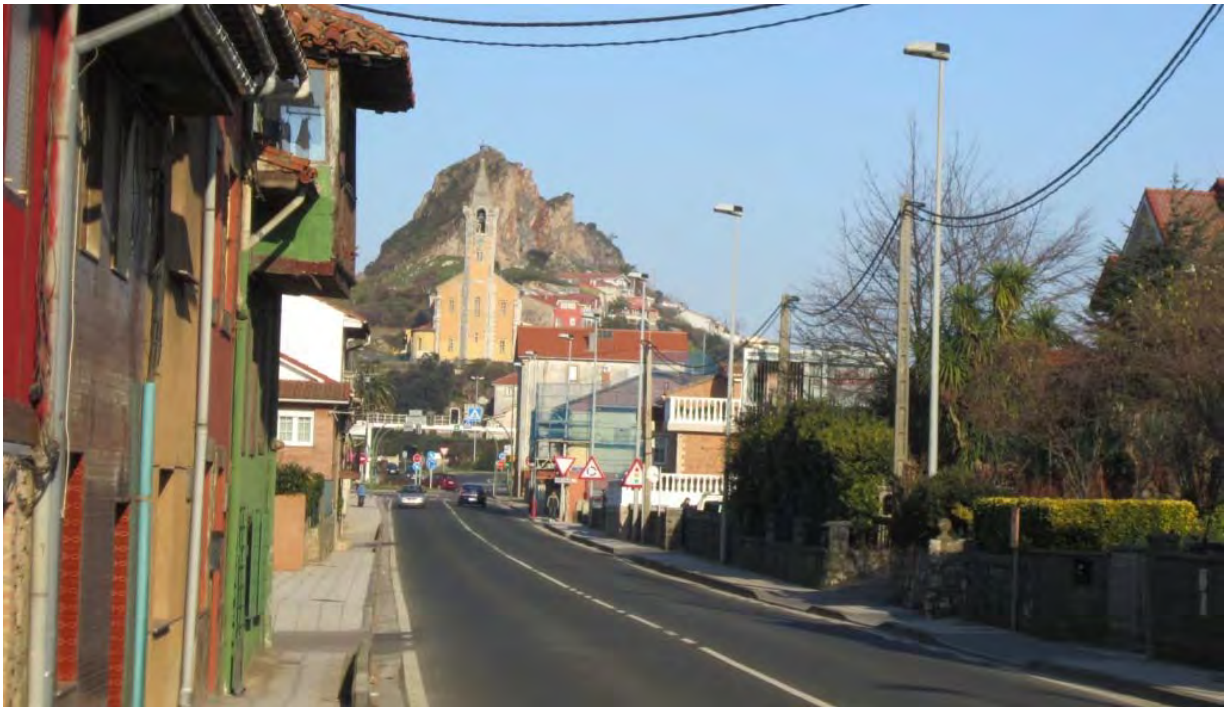
Photo : L'arrivée (laborieuse quoique sous le soleil) dans l'agglomération de Santander, Espagne.

Ca n'est pas gravissime sauf que l'hiver les journées sont courtes et que je m'aperçois que ce sont 2h chaque jour que je passe à chercher la sortie. 2h qui me font défaut l'après midi et me font terminer la journée à la lampe électrique pour trouver un coin où planter la tente !