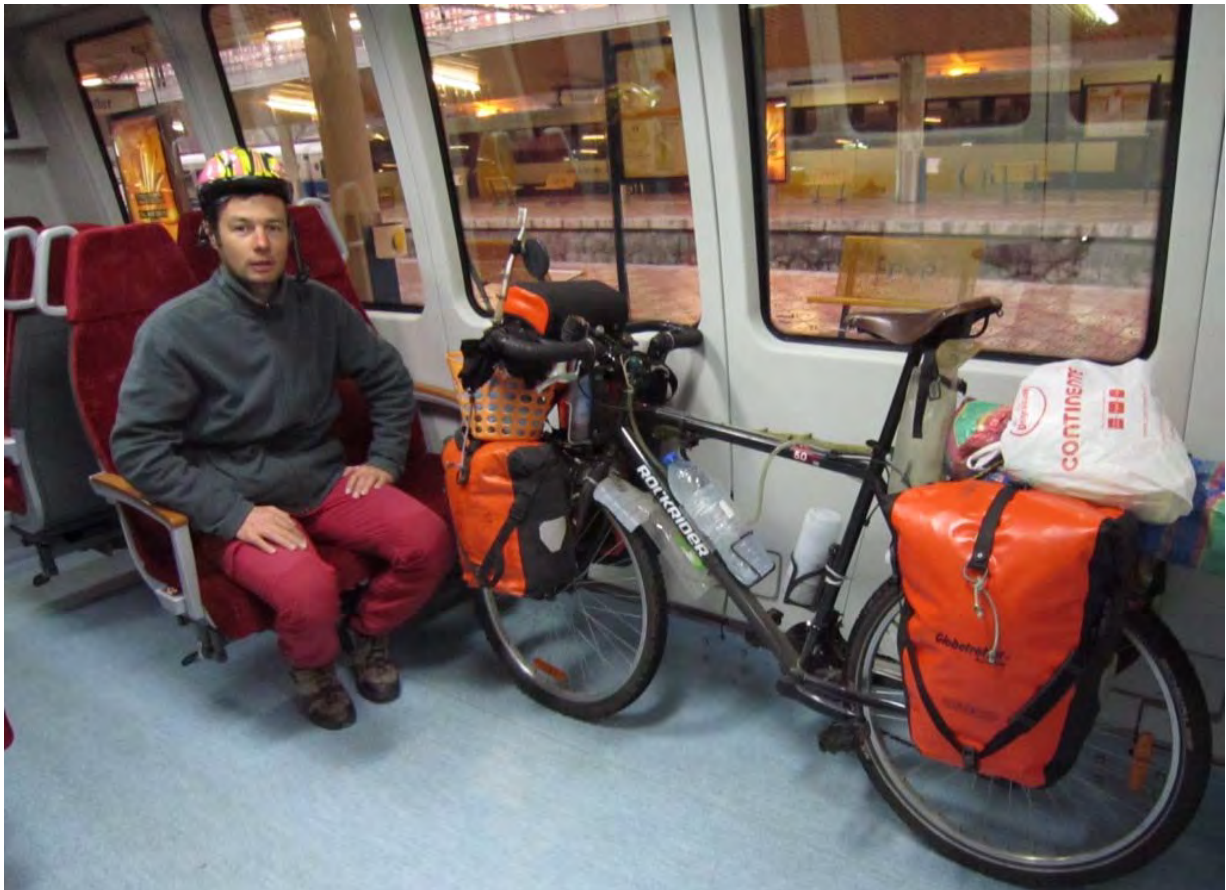
Photo : En retard sur le planning ? No souci, avec le train. Comme on me l'a dit qq jours avant, avec "el casco, el casco !", c'est plus prudent !

Cantabries et Pays Basque. Arrivé à Santander, je me pose a l'Hostel B&B pour souffler 24h. Comme c'est la basse-saison, on n'est que trois clients et je peux même monter mon vélo dans la salle commune. Je suis claqué après ces 7 nuits passées dans le froid. Plus d'énergie pour aller visiter cette ville moyenne qui semble pourtant pleine d'attraits. Le lendemain, je prends le train pour me rapprocher le plus possible de la frontière. J'ai promis à ma sœur de passer chez eux dans deux jours. Comme j'ai déjà décalé d'une semaine mon arrivée dans les Pyrénées, ce coup-ci, je vais tacher de tenir mes délais !