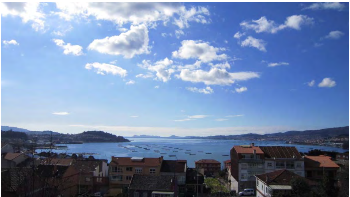
Photo : Baie de Redondela, Galice, Espagne.

----- Note : Retrouvez d'autres photos en plein format liées à ces étapes sur l'album Flickr d' Espagne : http://www.flickr.com/photos/grui_grui/sets/72157629246963614/ -----