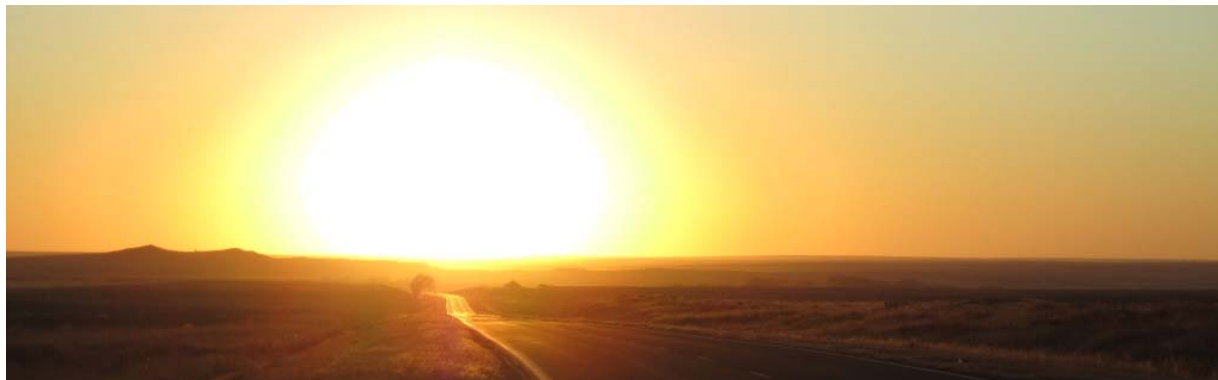
Photo : Coucher de soleil sur la route US 40, non loin d'Oakley, Kansas.

Mdt episode 126 - Kansas - Missouri - Illinois - Indiana - Ohio - West Virginia - Pennsylvanie