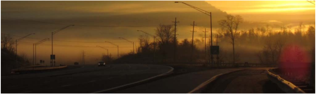
Photo : départ dans les brumes glaciales. Everett, Pennsylvanie.

Retrouvez l'album-photos "USA" en ligne sur Flickr : cliquez sur http://www.flickr.com/photos/grui_grui/sets/72157627439189259/