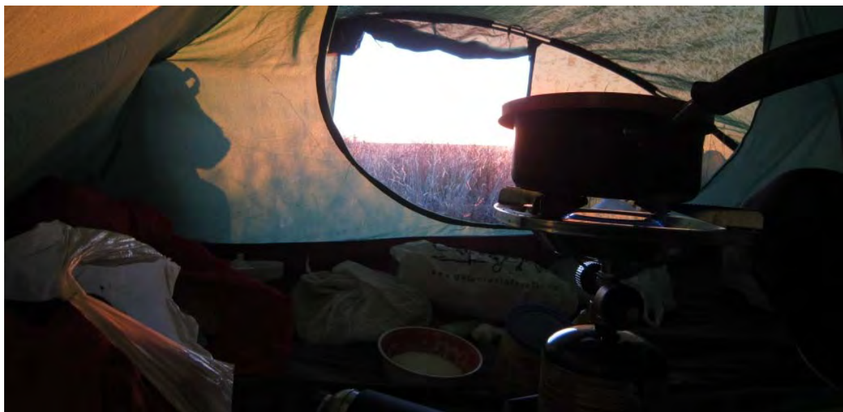
Phot : petite séance de cuisine dans la tente.

Coup de malchance, juste après ce constat, voilà le shérif qui m'arrête. Ah j'ai eu droit à mes appels de phares, les gyro et la sirène dans mon rétroviseur. Ensuite, il était finalement aussi ennuyé que moi, une fois m'avoir rappelé qu'il était interdit de circuler ici en vélo, et que je lui ai demandé ce qu'on faisait alors. Pas de sortie avant 15 km, et pas d'autre route... Et puis finalement, on a chargé le vélo dans son pick-up et il m'a conduit à l'entrée de la ville suivante où j'ai pu récupérer l'ancienne route US 40 qui longe la highway.