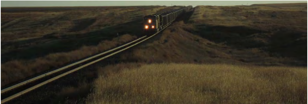
Photo : bivouac un peu trop près du chemin de fer pour pouvoir l'oublier : toutes les trois heures, c'est Beyrouth !

Ah les réalités du cyclotouriste. Jamais je n'aurais imaginé ramer pour trouver un coin de bivouac dans un état comme le Kansas, mais c'est comme ça.