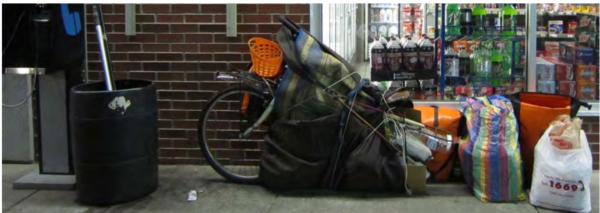
Photo : embarquement pour un trajet en bus Topeka (KS) – Columbus (OH) : le vélo se retrouve emballé dans la tente.

A Topeka, j'avais pris contact via CouchSurfing avec Jim et Lisa qui m'ont hébergé trois jours dans leur petite maison de banlieue. Un couple très accueillant et sympathique chez qui j'ai vraiment pu récupérer. J'en ai profité aussi pour recalculer mon itinéraire, en fonction des jours restants et surtout trouver un bus pour zapper toute une partie qui m'apparaissait comme monotone dans le centre des USA.