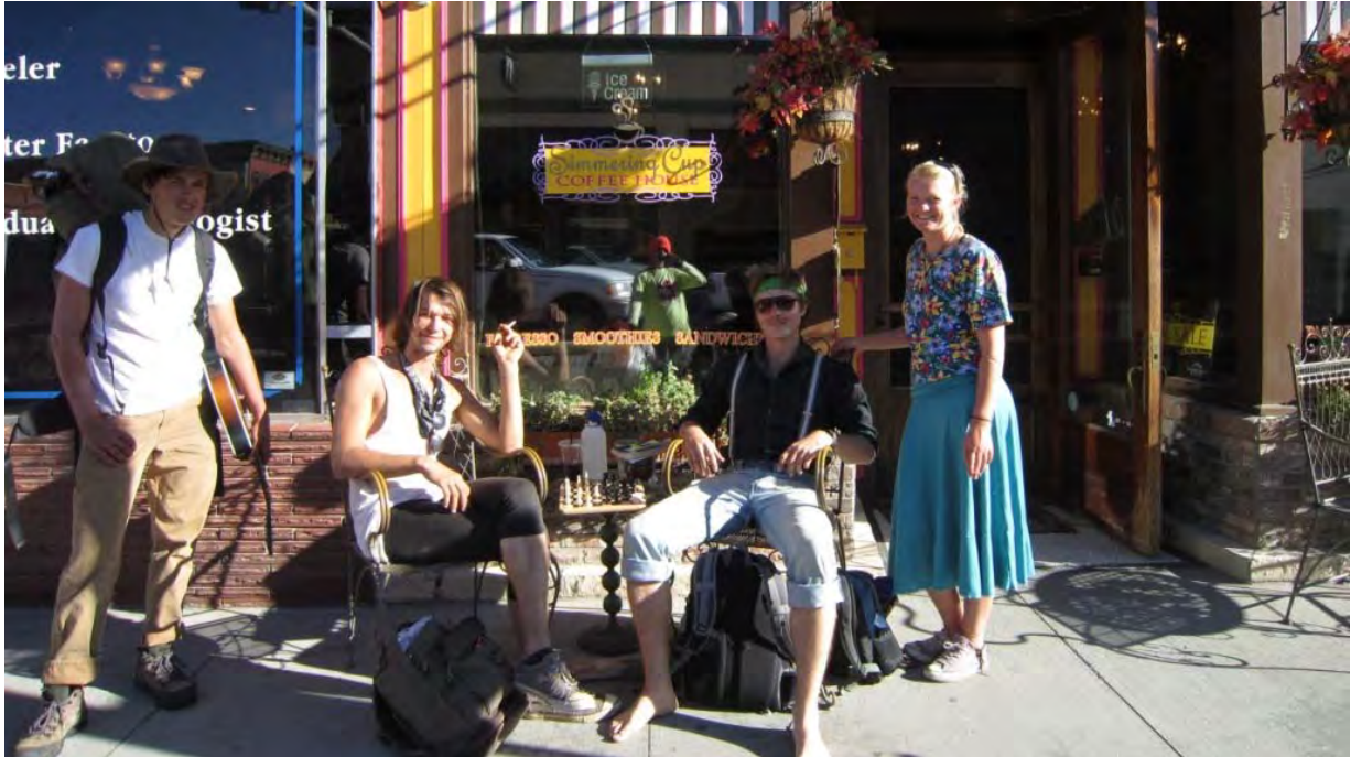
Photo : jeunes à Salida, pris en photo par l'espèce de sauvage que l'on voit dans le reflet.

entre Hooper et le fameux col de Poncha.