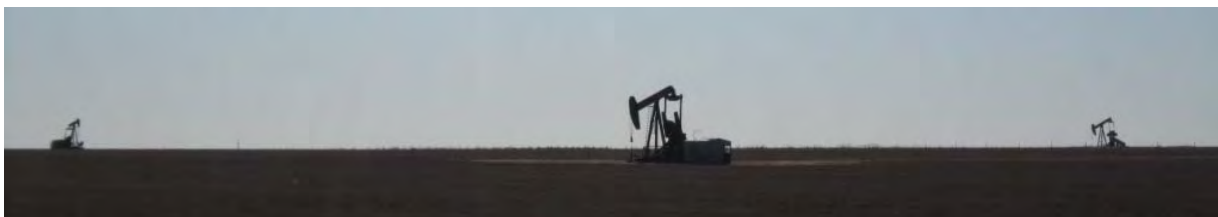
Photo : des puits de pétrole, Colorado.

Pas grand chose à voir autrement, ici... Des champs de blé, des silos à grains, qq puits de pétrole et de rares poids lourds qui me dépassent.