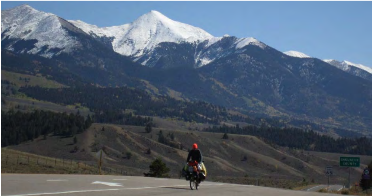
Photo : Enfin au col de Ponch, (2 700 m et un froid mordant), plus que de la descente jusqu'à Salida.

Photo : La neige fait son apparition, au loin pour le moment.