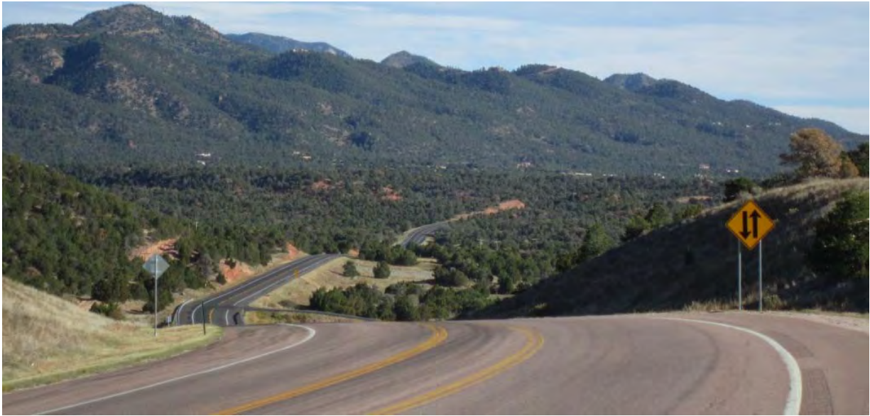
Photo : La route 115, traversant "Bighorn Sheep Canyon", Colorado.