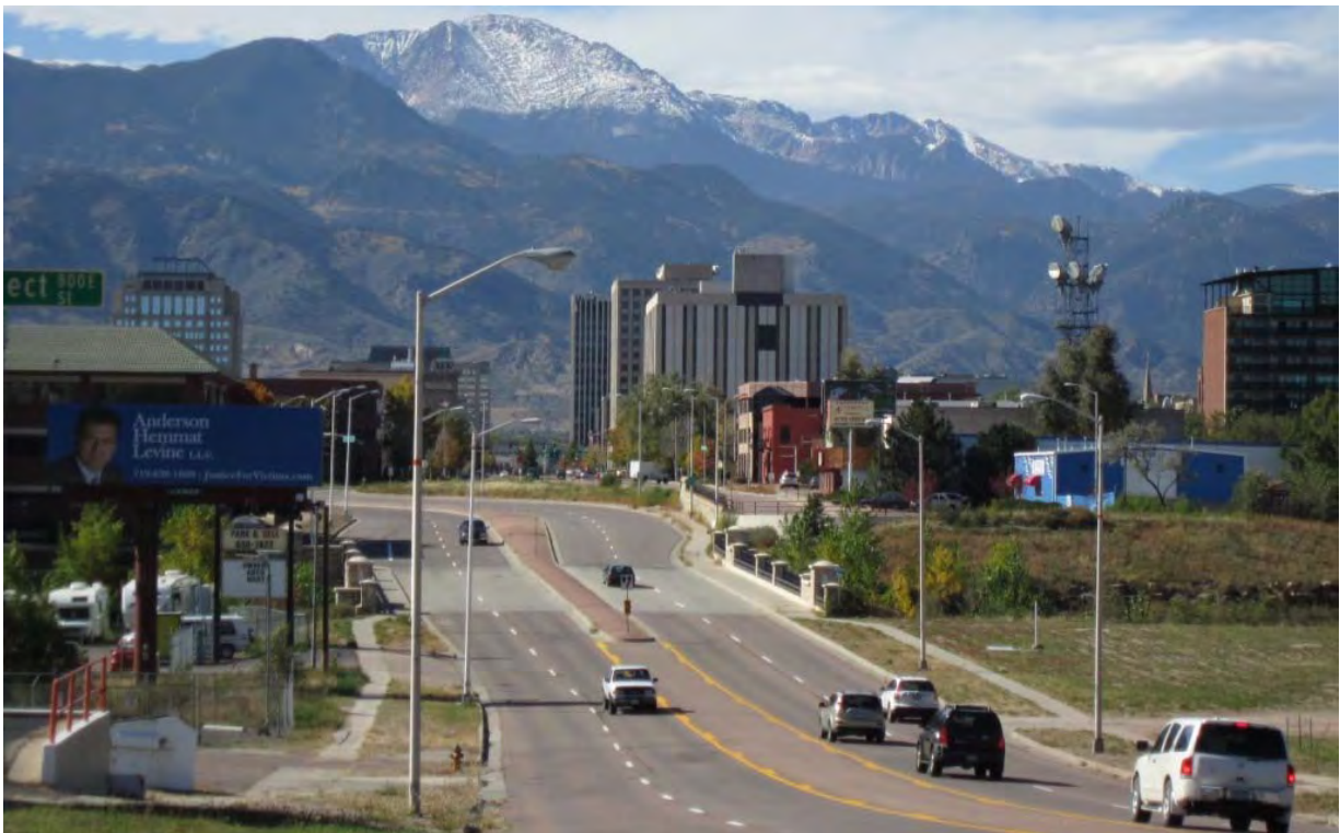
Photo : arrivée à Colorado Springs.