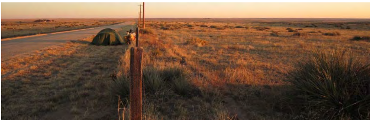
Photo : bivouac en bord de route près de Cheyenne Wells, US 40, Colorado