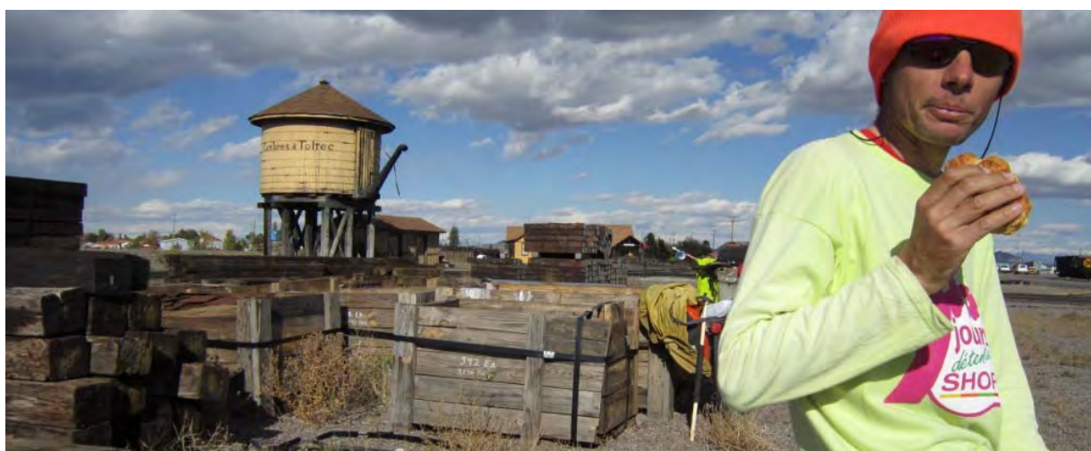
Photo : pause sandwich à Cumbres & Toltec, Colorado.

Mardi 11 octobre 2011 Antonito, Colorado, États Unis 1671eme jour du Mour du Tonde. 50 474 km soit 31 363 miles