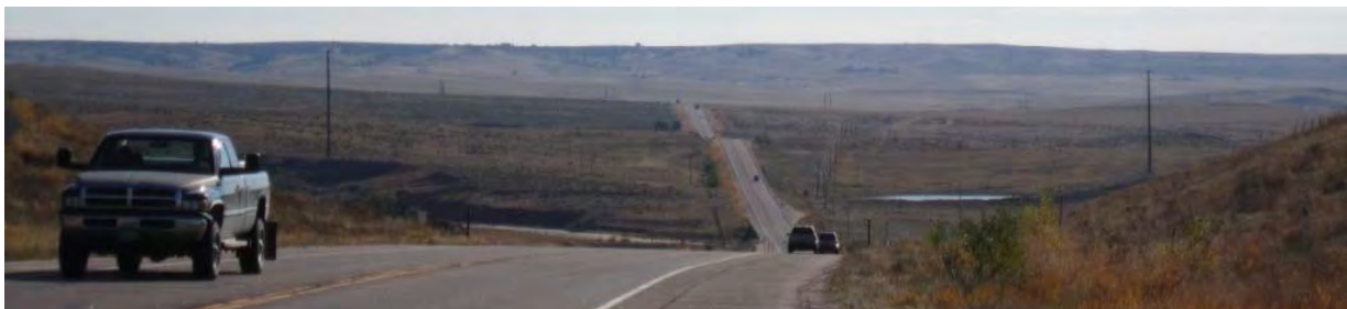
Photo : Cap à l'est par la route US 40, Colorado.