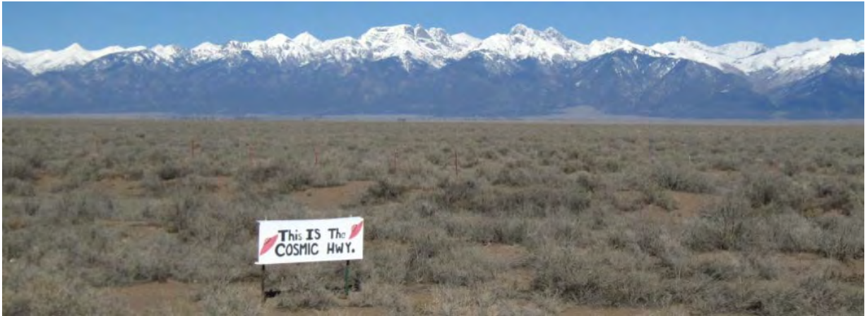
Photo : Cosmic highway. Le long de la SR 17, près de Hooper.

Tellement désertique que quelqu'un a décidé d'attirer le touriste en créant un centre d'observation des extra-terrestres et des OVNI, n'étant parasité par aucune pollution lumineuse alentour.