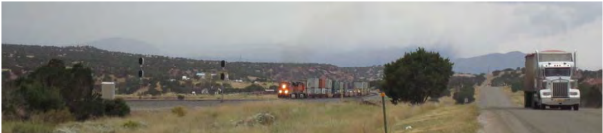
Photo : Matinée cernée par les poids lourds et les convois ferrés : parfois quatre imposantes motrices diesel trainant 400 plateaux sur lesquels sont empilés deux containers ! Le temps devient de plus en plus menaçant. Mountainair, Nouveau Mexique.

Pourtant, tout semblait se dérouler dans une certaine continuité : les premiers km au Nouveau Mexique ressemblaient assez aux déserts qui avaient précédés au fil des km en Arizona. L'arrivée sur des sites tels que l'observatoire astronomique "Very Large Array", une escale dans la riante petite bourgade de Magdalena ou bien la traversée des plaines de Galisteo, décors de cinéma grandeur nature pour tourner des westerns sans aucun élément anachronique à devoir dissimuler (autoroute, ligne à haute tension, immeubles ou couloir aérien), tout semblait annoncer une foule de curiosités pour nourrir le voyage de sa ration de surprises.