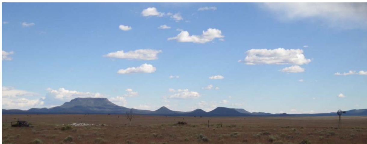
Photo : Toujours un air de désert, Omega, NM.