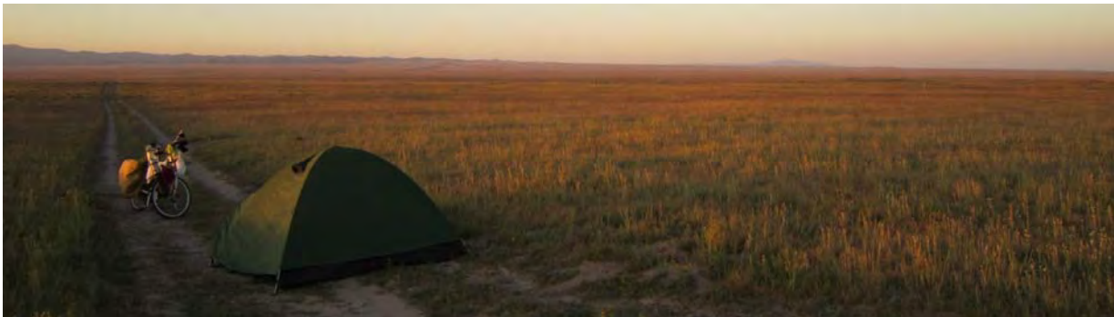
Photo : Bivouac à proximité de l'observatoire appelé "Very Large Array", où, grâce à une trentaine d'immense parabole, on écoute les signaux venus des étoiles !