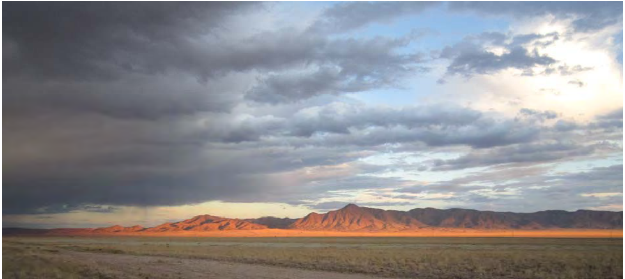
Photo : Coucher de soleil, près de Bernardo, Nouveau Mexique.

2 000 miles donc, ça fait donc 3 200 km à pédaler en...hum, hum...environ 40 jours car mon avion est le 17 novembre ! Oulala, faut pas trop lambiner si je veux me garder des jours off pour visiter New York plus un ou deux jours de repos par semaine....