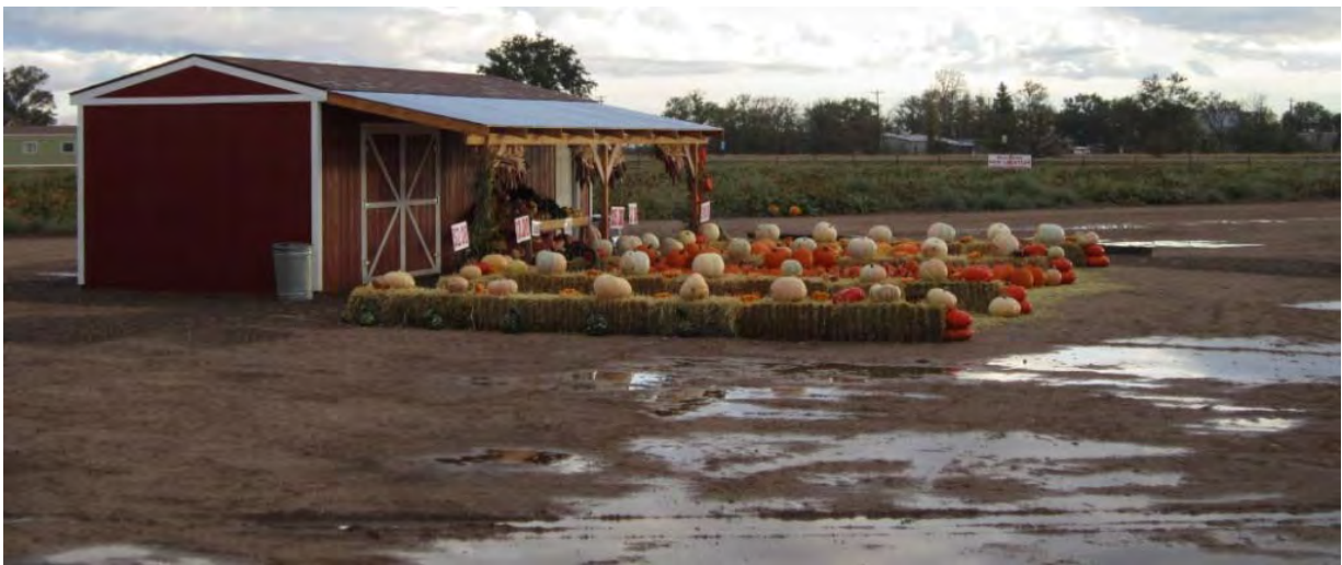
Photo : bivouac près d'un centre d'exposition de citrouilles, juste avant Halloween, Mountainair, NM.

Tempête sur tempête toute la nuit. A 05h00, impossible de démarrer : il pleut trop. Je me recouche. A 7h00, ce n'est pas beaucoup mieux. Je me prépare tout de même et m'approche du portail. Mince, il est fermé. C'est ballot mais ça me fait contourner tout son près : pousser le vélo dans la boue pour atteindre un autre coin de l'enclos resté ouvert. Juste de quoi se tremper les pieds avant le départ. Une fois le vélo sur le goudron et moi sur la selle, les choses devaient se "normaliser" mais voila le vent latéral qui menace de rabattre des nuages suspects. Opération déploiement du poncho à arrimer aux sacoches avant et arrière.