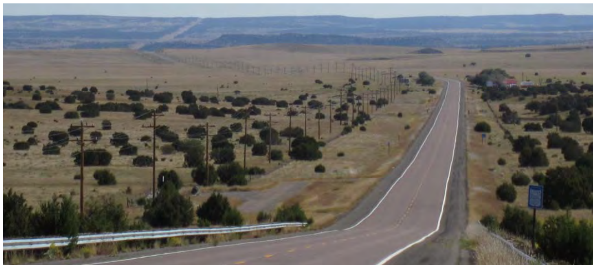
Photo : Premiers km au Nouveau Mexique. Ca s'annonce plutôt désertique. Red Hills, NM.

Retrouvez l'album-photos "USA" en ligne sur Flickr : cliquez sur http://www.flickr.com/photos/grui_grui/sets/72157627439189259/