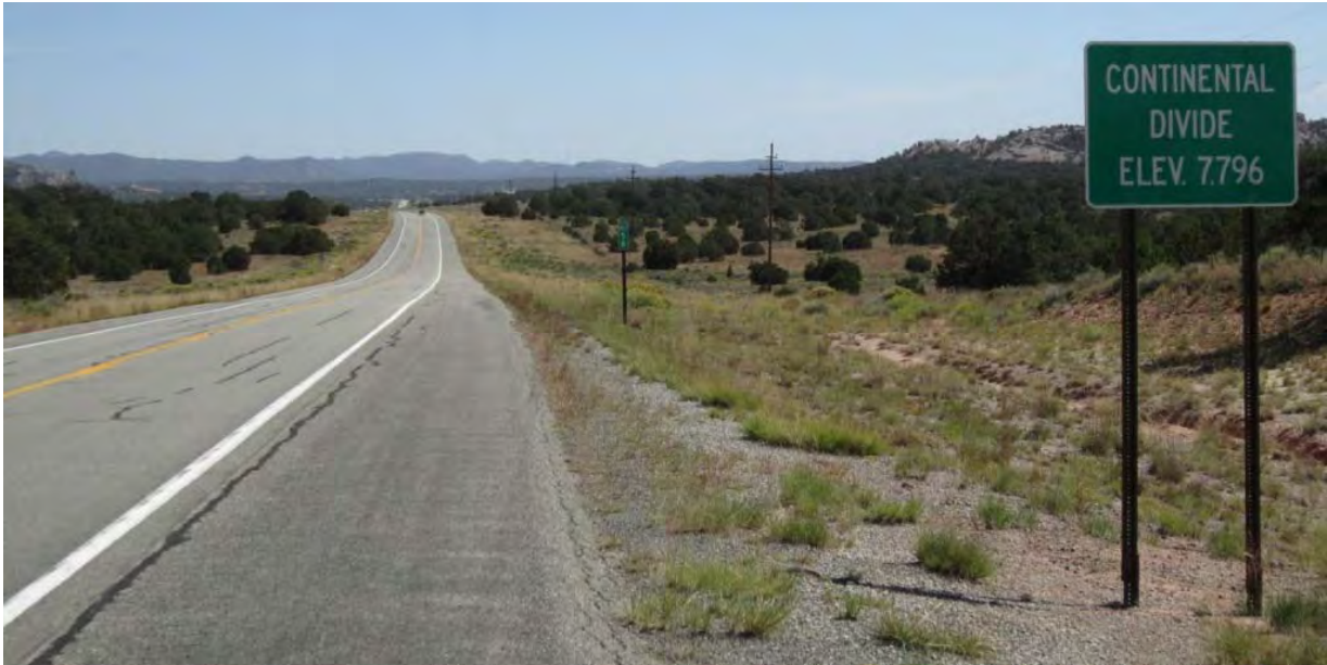
Photo : La ligne de partage des eaux, près de Pie town, NM.