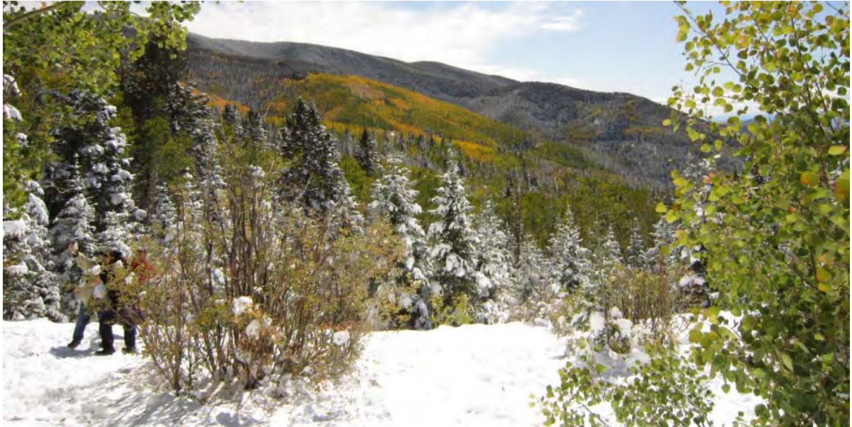
Photo : Hide Park, Santa Fe, NM.

Mince alors, c'est trop cher. Qu'à cela ne tienne ! Direction l'armée du salut pour un look revu et corrigé !