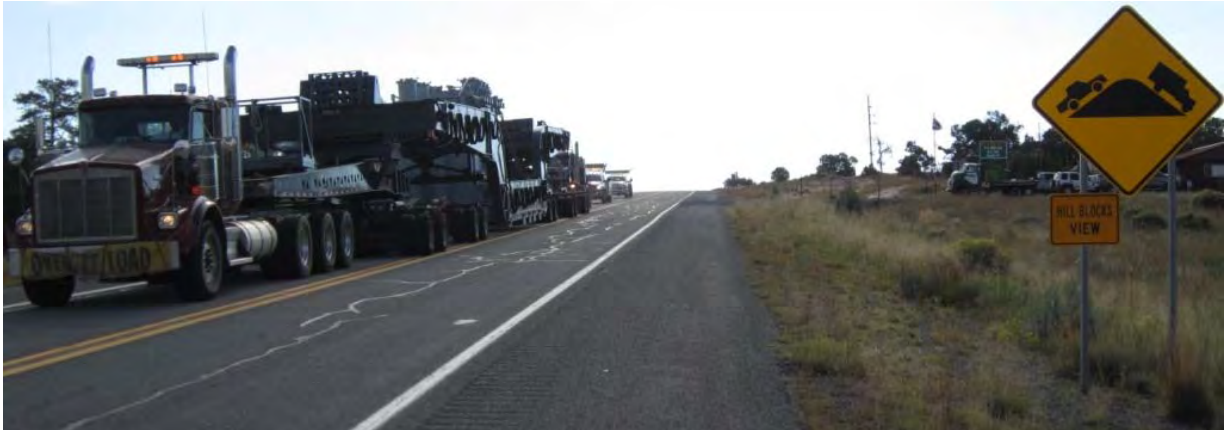
Photo : Convoi exceptionnel, Pie town, NM.

Pourtant, tout semblait se dérouler dans une certaine continuité : les premiers km au Nouveau Mexique ressemblaient assez aux déserts qui avaient précédés au fil des km en Arizona. L'arrivée sur des sites tels que l'observatoire astronomique "Very Large Array", une escale dans la riante petite bourgade de Magdalena ou bien la traversée des plaines de Galisteo, décors de cinéma grandeur nature pour tourner des westerns sans aucun élément anachronique à devoir dissimuler (autoroute, ligne à haute tension, immeubles ou couloir aérien), tout semblait annoncer une foule de curiosités pour nourrir le voyage de sa ration de surprises.