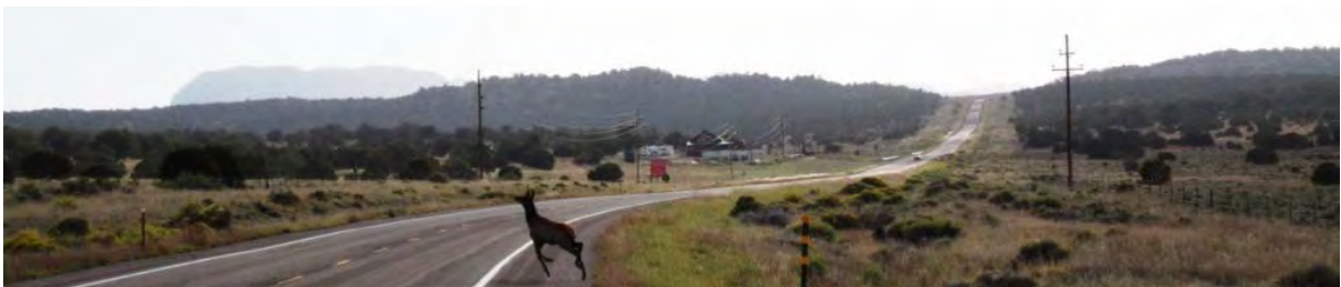
Photo : Cerf sans bois, mais avec du ressort.

Deux heures plus tard, le gros temps se levait et le reste de la journée compensera ce démarrage un peu déprimant. Ouf !