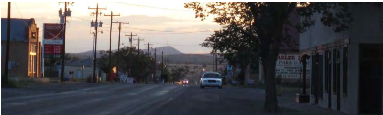
Photo : Magdalena, Nouveau Mexique.