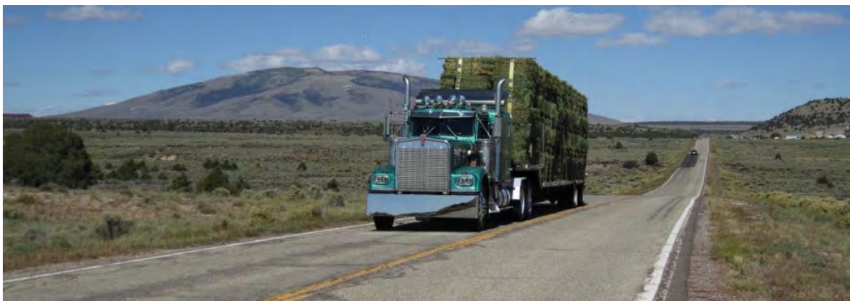
Photo : Toute la journée, je croise des poids lourds chargés de foin, venant du nord. Ils me doublent à vide lorsqu'ils remontent. Au bout d'un moment, on se reconnaît, alors on se klaxonne !

Entre les lignes, je trouve qu'on sent une certaine gêne à évoquer le sort réservé aux indiens qui ont cru bon de tenter de défendre leur terre ! Entre les "bâtons de feu", la chasse de leur gibier et la christianisation forcée, ils ont été servis !