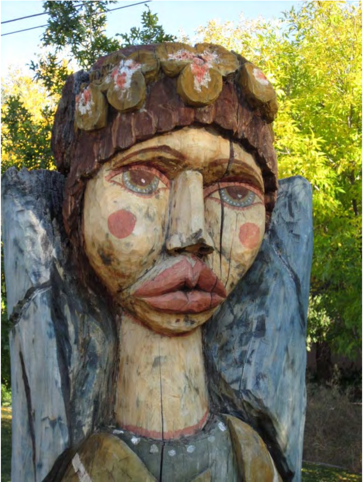
Photo : sculpture de rue, Santa Fe.