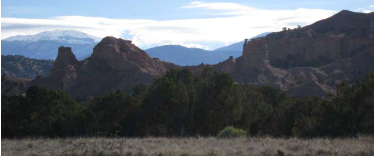
Photo : Les paysages deviennent dignes du Colorado de Lucky Luke...pourtant on est encore au Nouveau Mexique.