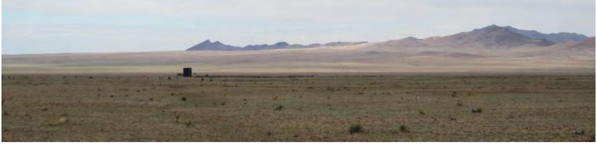
Photo : Socorro Plains, Nouveau Mexique.

Après l'épreuve du feu des déserts californiens et arizoniens, quelle joie de goûter, sans transition aux rigueurs de l'hiver précoce néo-mexicain et coloradien.