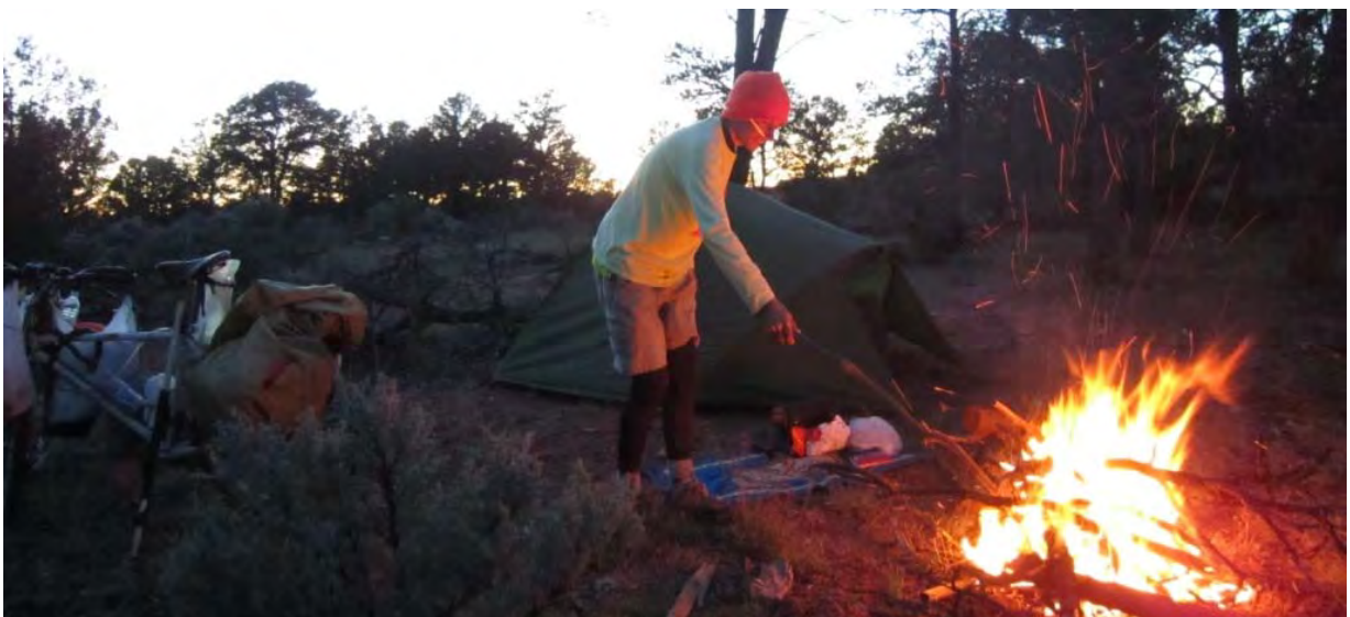
Photo : le feu de bois du soir : un réconfort bienvenu à l'heure où la température tombe.

Plein nord en quittant Santa Fe par la route 285, là, fini de rigoler car c'est le Colorado qui s'annonce. Et avec lui, son lot de reliefs un peu craignos et de nuits fraîches en perspective... Surtout que j'ai encore en mémoire mon séjour prolongé chez Joel, qui m'hébergeait en ville. Prolongé pour cause de neige. On est début octobre et il y avait 10 cm de neige dans tout Santa Fe. Mazette, et dire que j'ai un col à passer à 2 700 m. On va bien s'marrer.